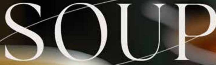
▲ Cream of pumpkin soup ซูปครีมฟักทอง