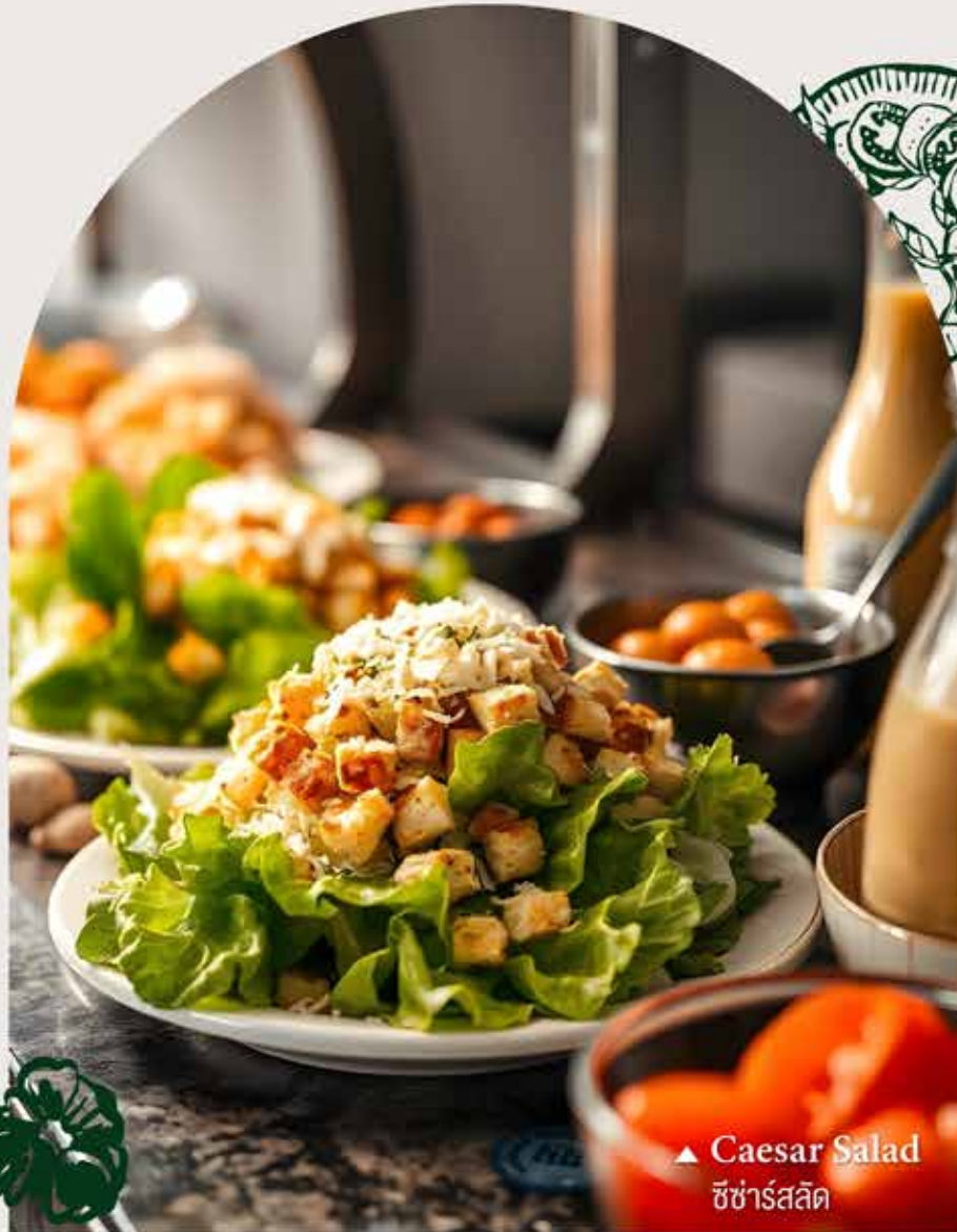
▲ Caesar Salad ซีซาร์สลัด