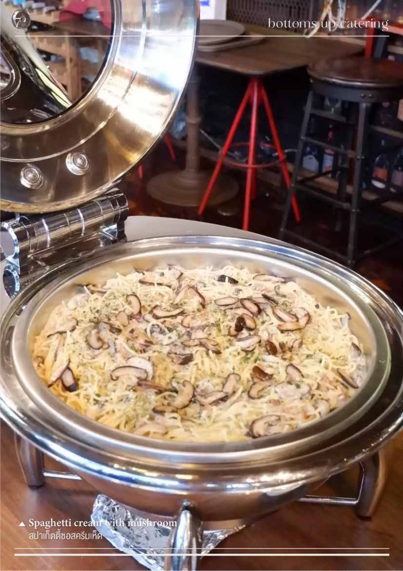
▲ Spaghetti cream with mushroom สปาเกตตีซอสครีมเห็ด