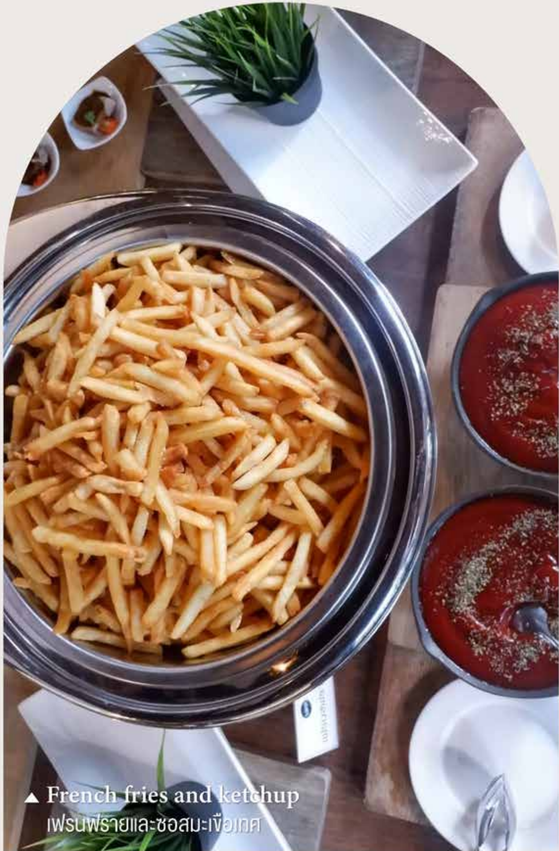
▲ French fries and ketchup เฟรนช์ฟรายและซอสมะเขือเทศ